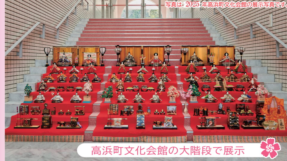
高浜町文化会館の大階段で展示